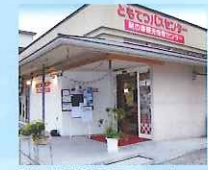
「鞆の浦観光情報センター」多くの撮影スタッフが訪れました。監督や俳優のサインも展示