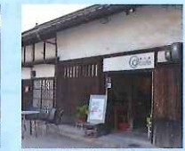
常夜灯前の「ア・カフェ」撮影スタッフが多く訪れていたそうです